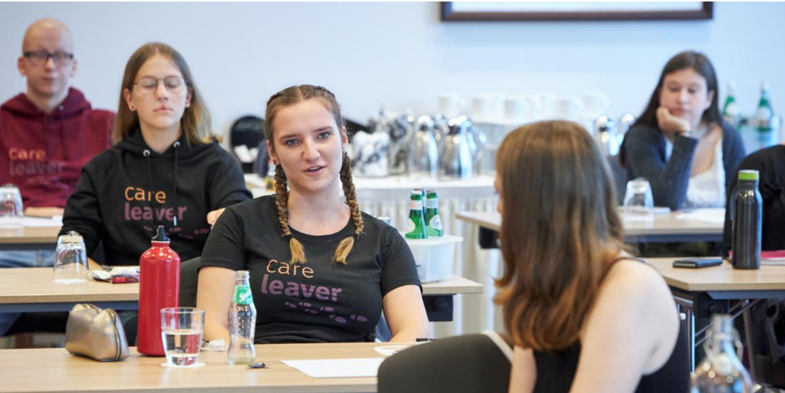
Netzwerktreffen Bremen, Sept. 2020

„Ich wusste bisher nicht, dass es auch andere Pflegekinder gibt, die Abitur haben.“ „In gewisser Weise sind wir alle traumatisiert. Unsere Eltern meinten es oft nicht so gut mit uns.“