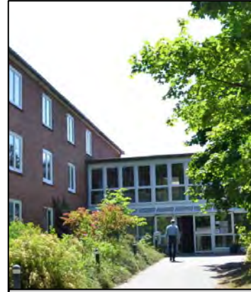
Berufsakademie (BA) Lüneburg Studiengang Soziale Arbeit