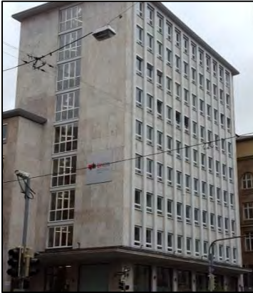
Duale Hochschule Baden-Württemberg (DHBW) Studiengang Soziale Arbeit